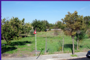
Per la prima volta in 15 anni, è stata pulita l'area in via Romagnoni accanto alla scuola Mirò