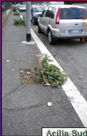
Potature estreme. Ormai sulle nostre strade di alberi ne sono rimasti ben pochi!