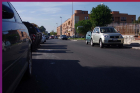
Riasfaltata la maggior parte delle strade del quartiere (anche se ora manca la segnaletica!)