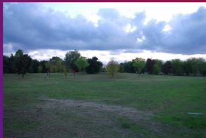
Migliorato lo sfalcio dell'erba in tutte le aree verdi.