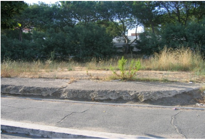
all. foto 3-4