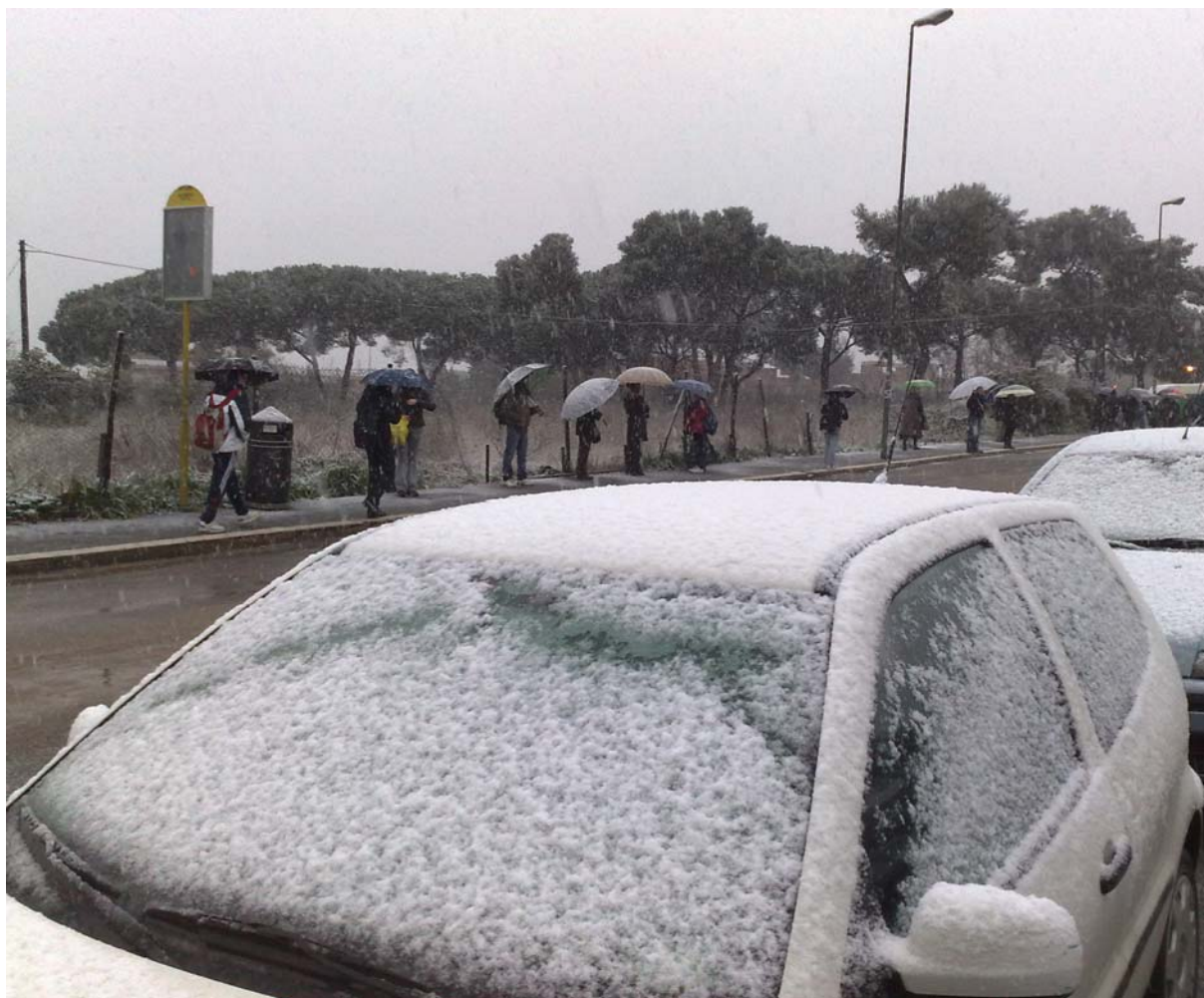
Capolinea delle linee 03 e 065 presso la stazione di Acilia.