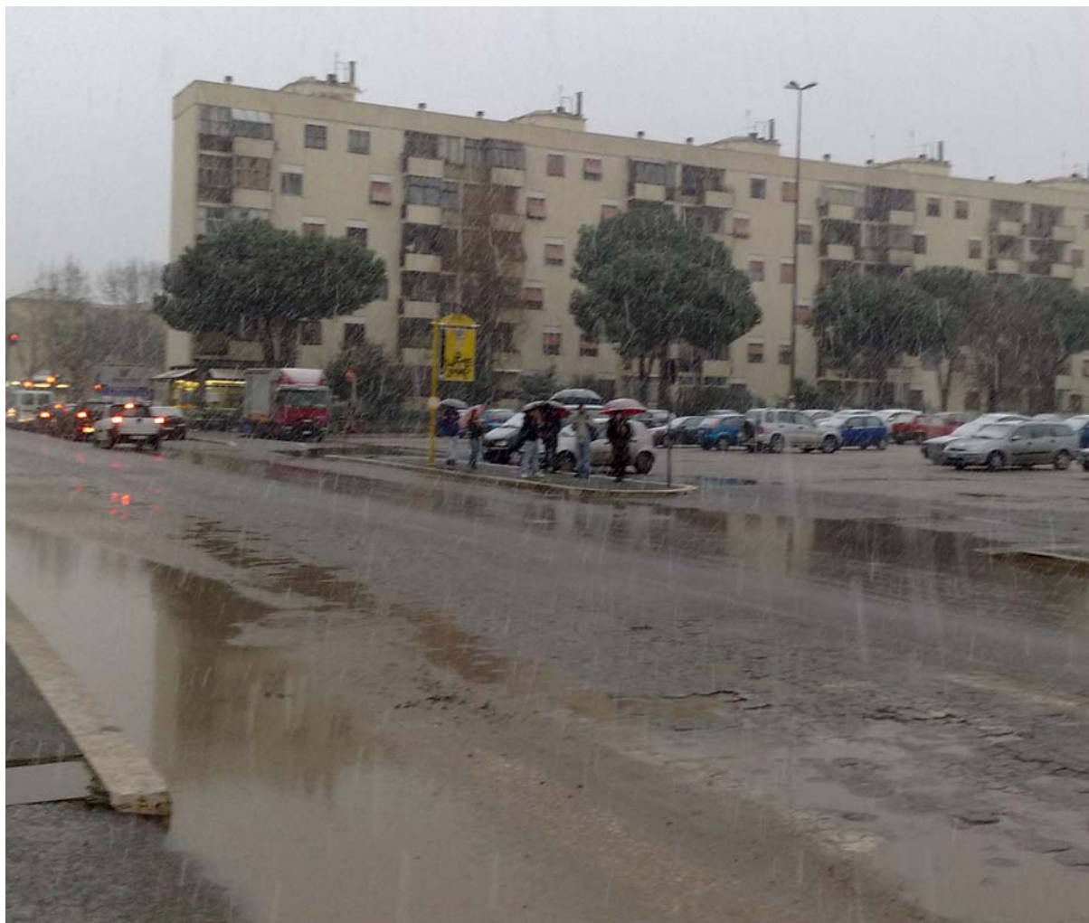
Fermata di Via Saponara di fronte all'autodemolitore.